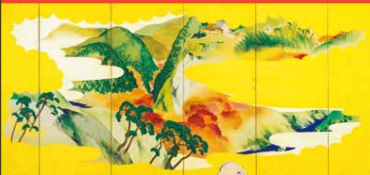
矢野夜潮《高雄秋景・嵐山春景図屏風》(右隻)中・後期展示

本展では、円山応挙の《虎図》や《陶淵明図屏風》などを展示するほか、応挙が創り出した「新しい日本画」がどのように展開していったのかを、弟子である源琦(1747～1797)や長沢芦雪(1754～1799)の作品を通してご紹介します。さらに今回は、新発見の作品として、応挙の弟子・山口素絢(1759～1818)に師事した矢野夜潮(1782～1829)の作品約40点*も特別に展示いたします。江戸時代の画家たちが織りなす多彩な表現の世界を、ぜひご堪能ください。(※展示替えあり)