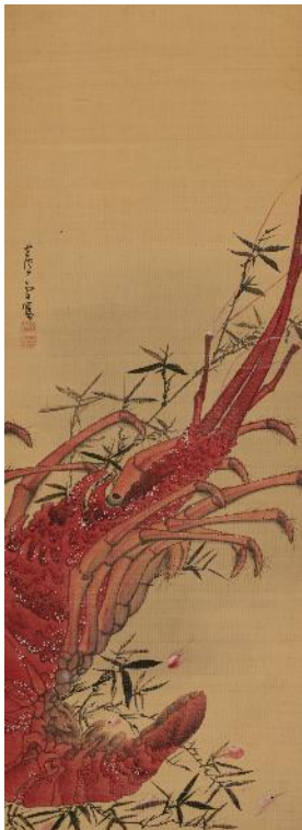
長沢芦雪《海老図》 18世紀 福田美術館蔵 前期展示