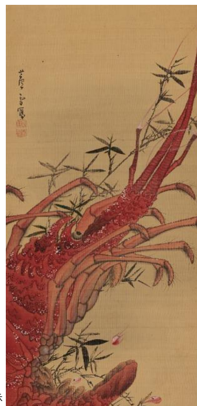
長沢芦雪《海老図》（部分）18世紀 福田美術館蔵 前期展示

武士の家に生まれながら、応挙の一番弟子として活躍した芦雪は、師の端正な画風を土台としながらも、大胆な構図と機知に富んだ演出によって、観る者を驚かせる「奇」の表現を追求しました。彼の筆致はときに軽妙でユーモラス、ときに凄まじい迫力を湛え、画面からはみ出さんばかりの躍動感を生み出しています。 長沢芦雪《海老図》 はまさに芦雪ならではの 大胆な構図とユニークな作風 を目の当たりにできる作品です。