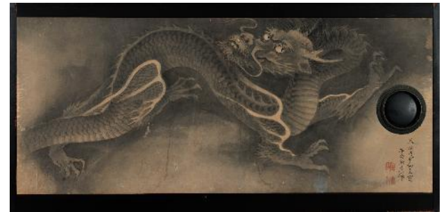
円山応挙《龍図襖》（右隻）1788年 福田美術館蔵 前期展示