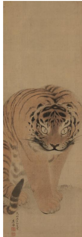
円山応挙《虎図》 1786年 前期展示