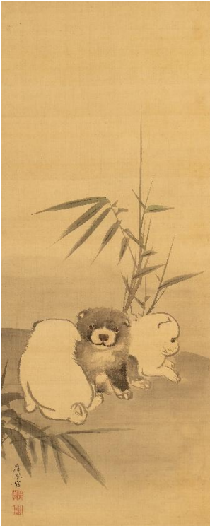
円山応挙 《竹に狗子図》1779年 福田美術館蔵 後期展示