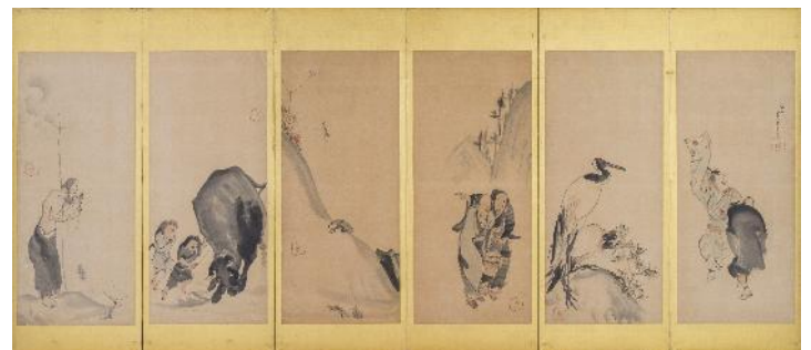
長沢芦雪 《山水鳥獣人物押絵貼屏風》（右隻）18世紀 福田美術館蔵 後期展示