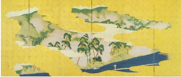
矢野夜潮《高雄秋景・嵐山春景図屏風》（左隻） 19世紀 福田美術館蔵 中期・後期展示