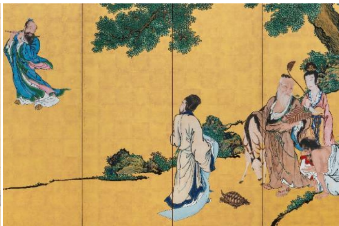
岸駒《群仙図屏風》1786年 個人蔵（右隻・部分）前期展示 ※初公開作品