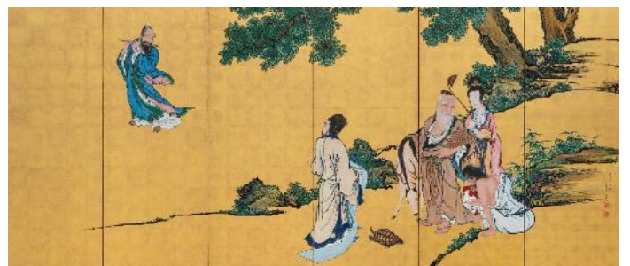
岸駒《群仙図屏風》1786年 個人蔵（右隻）前期展示 ※初公開作品