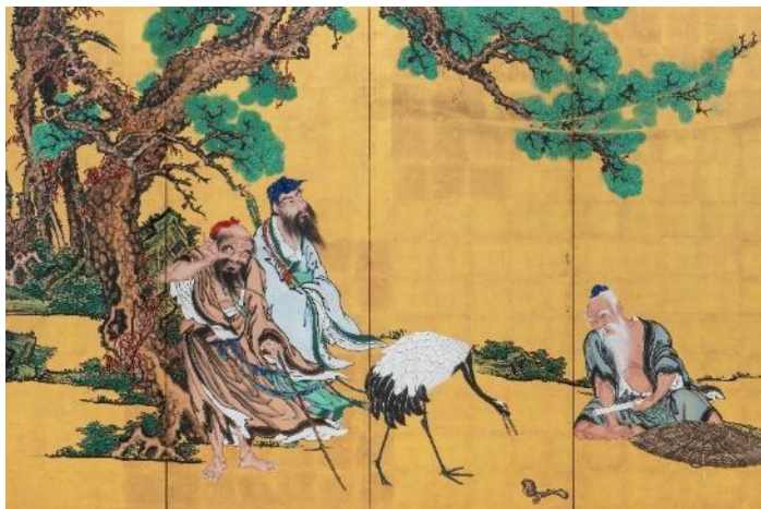
岸駒《群仙図屏風》1786年 個人蔵（左隻・部分）前期展示 ※初公開作品

師の画風を模倣するのではなく、独自の画風を模索し続けた芦雪と岸駒の2人の作品から、江戸後期画壇の熱きエネルギーを感じることができるでしょう。