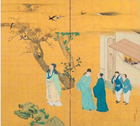
円山応挙《陶淵明図屏風》1778年 福田美術館蔵 中期展示