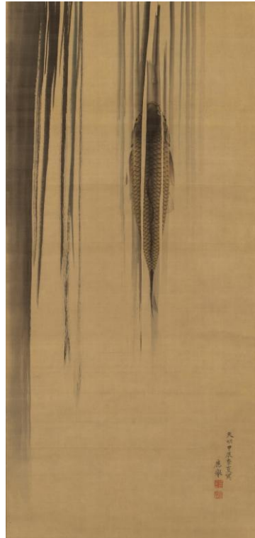
円山応挙《龍門鯉》1784年 中期展示 福田美術館蔵