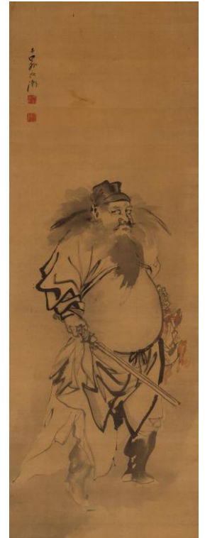
矢野夜潮《鍾馗図》 19世紀 個人蔵 前期展示 ※初公開作品