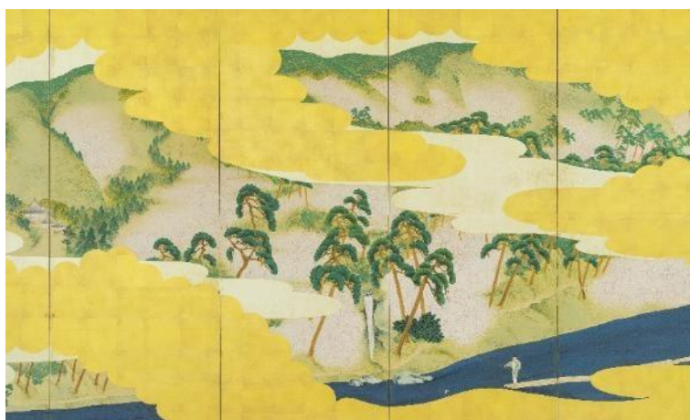
矢野夜潮《高雄秋景・嵐山春景図屏風》（左隻・部分） 19世紀 福田美術館蔵 中期・後期展示