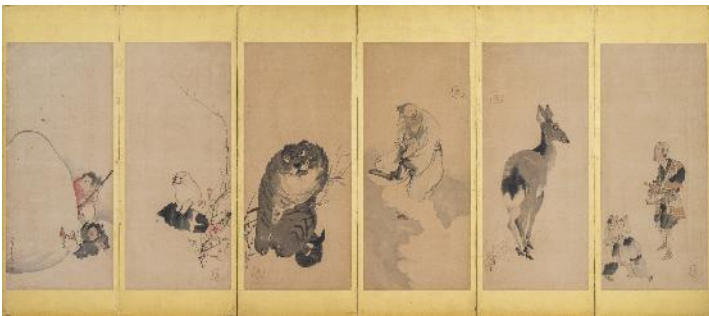
長沢芦雪 《山水鳥獣人物押絵貼屏風》（左隻）18世紀 福田美術館蔵 後期展示