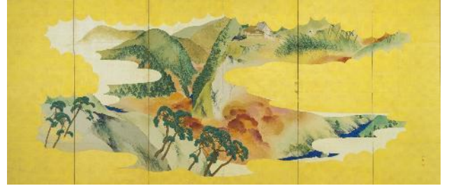
矢野夜潮《高雄秋景・嵐山春景図屏風》（右隻） 19世紀 福田美術館蔵 中期・後期展示