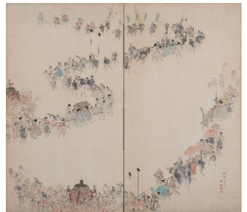
矢野夜潮《祇園祭儀図屏風》19世紀 個人蔵 前期展示 ※初公開作品