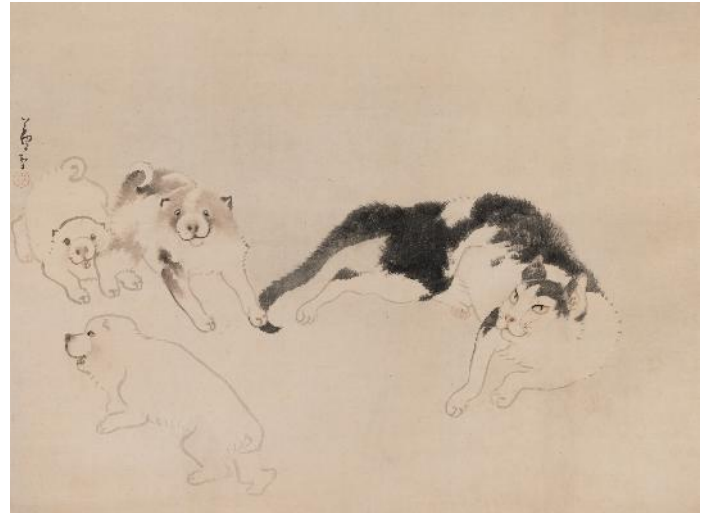
長沢芦雪 《猫と仔犬》18世紀 福田美術館蔵 中期展示