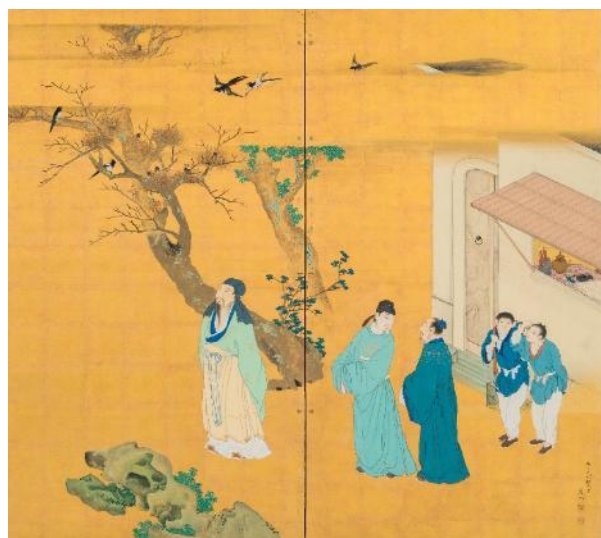
円山応挙《陶淵明図屏風》（部分）1778年 福田美術館蔵 中期展示

第1章では、中国の文学者・陶淵明（とうえんめい）らが金屏風に描かれた作品、 円山応挙《陶淵明図屏風》 など、 応挙の高い画力を実感できる名作 も見どころです。