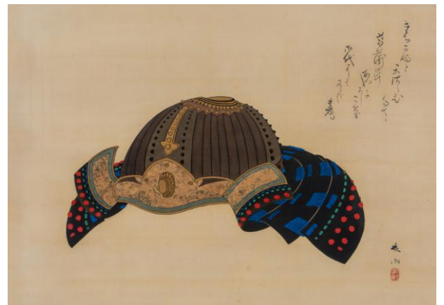
矢野夜潮画 賀茂季鷹 賛《兜図》19世紀 個人蔵 前期展示 ※初公開作品