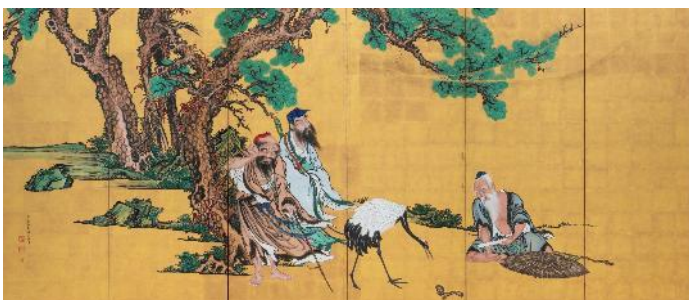
岸駒《群仙図屏風》1786年 個人蔵（左隻）前期展示 ※初公開作品