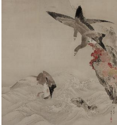
円山応挙《巖頭飛雁図》1767年 福田美術館蔵 前期展示