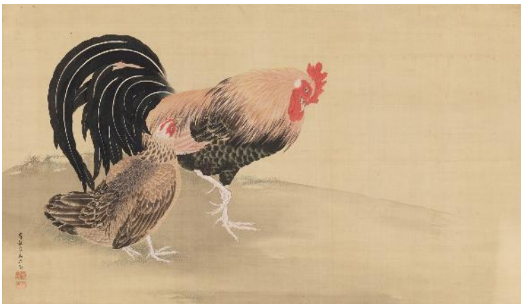
岸駒《双鶏図》18-19世紀 福田美術館蔵 後期展示