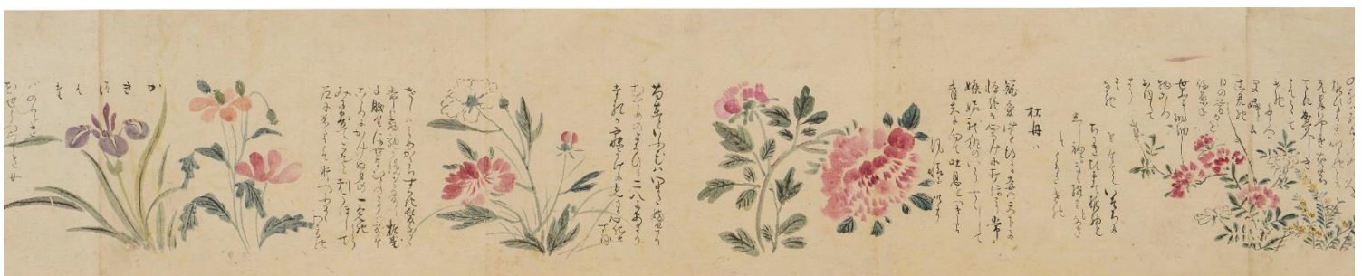
森川許六《百花譜》（部分）17世紀 ※会期中場面替えあり