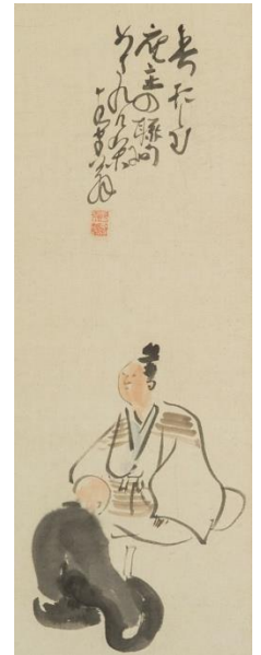
与謝蕪村《春借しむ》自画賛 (部分) 18世紀