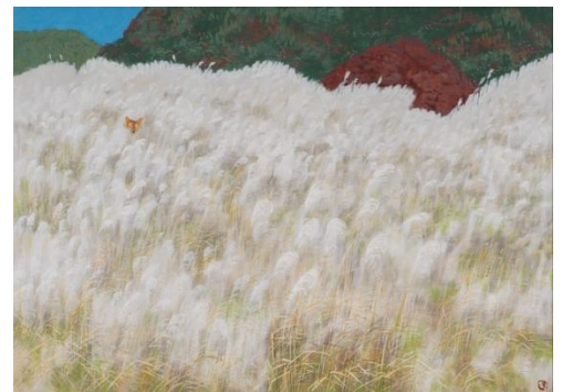
池田遙邨 《山頭火シリーズ すすきのひかりさえぎるものなし》 1988年頃

晩年は漂泊の俳人・種田山頭火（たねださんとうか）に心を寄せ、彼の句の世界を絵画化することに挑戦しました。これらは「山頭火シリーズ」と呼ばれ、現在28点が確認されていますが、ここではそのうちの4点とその下絵を展示します。京都では大変貴重な機会となりますのでぜひご覧ください。