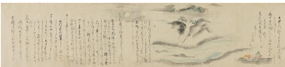
⑥ 松尾芭蕉《野ざらし紀行図巻》（大井川・秋の日の／道のへの／馬に寝て部分）17世紀