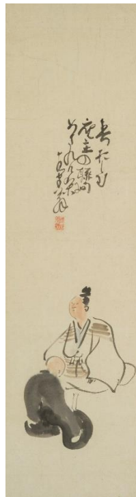
⑩ 与謝蕪村《春借しむ》自画像 18世紀