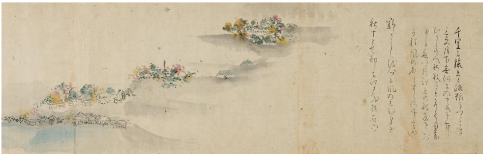
③ 松尾芭蕉《野ざらし紀行図巻》（冒頭・野ざらしを部分）17世紀