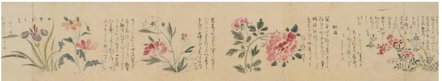
⑧ 森川許六《百花譜》（部分）1704年