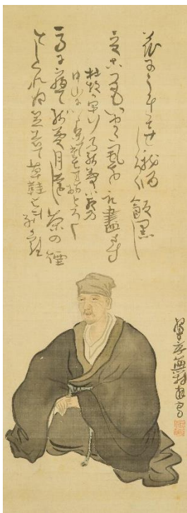
⑨ 与謝蕪村《松尾芭蕉像》 1782年頃