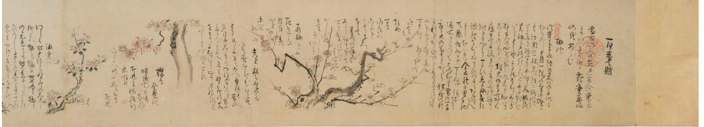
⑦ 森川許六《百花譜》（部分）1704年