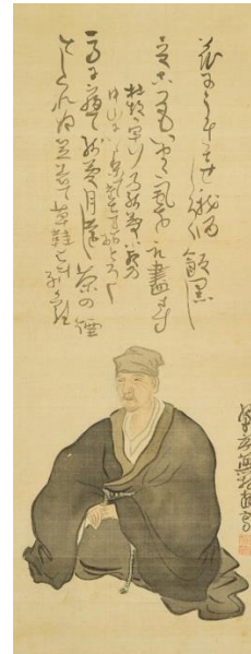
与謝蕪村《松尾芭蕉像》 1782年頃

本章では蕪村の俳画を多く展示するだけでなく、横井金谷（きんこく）などの弟子の作品や呉春による俳画も紹介します。