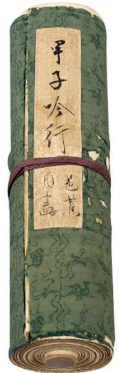
⑤ 松尾芭蕉《野ざらし紀行図巻》卷子 17世紀