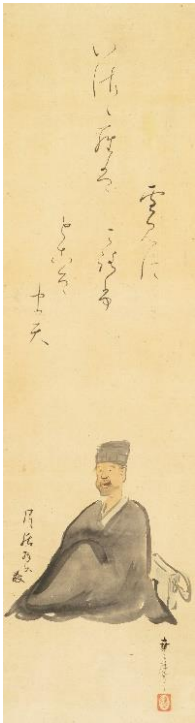
① 中村芳中《松尾芭蕉像》 18-19世紀