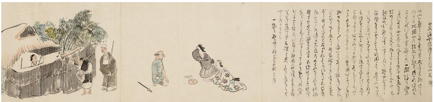
⑫ 了川《奥の細道図巻模写》（部分）1833年