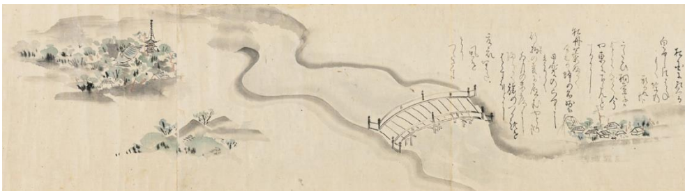
④ 松尾芭蕉《野ざらし紀行図巻》（白けしに／牡丹菫／甲斐・行駒の／江戸・夏衣部分）17世紀