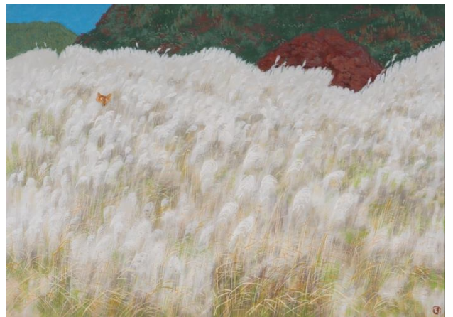
⑪ 池田達郎《山頭火シリーズ すずきのひかりさえぎるものなし》 1988年頃