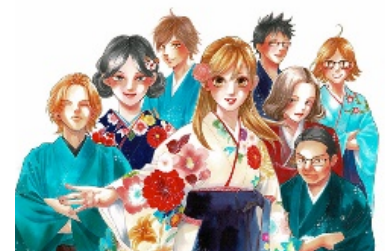
アニメ・映画化もされブレイクした「ちはやふる」