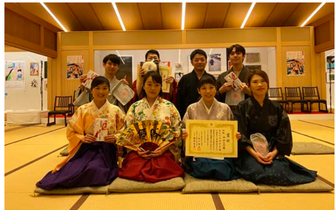
選手画像 (第一回の様子)