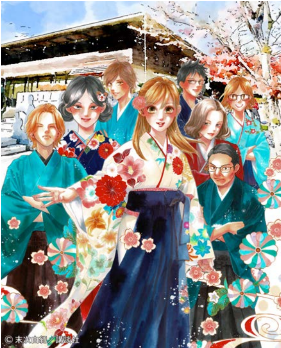
ちはやふる小倉山杯イメージ (末次由紀先生イラスト) _縦