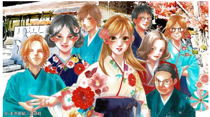
ちはやふる小倉山杯イメージ (末次由紀先生イラスト) _横