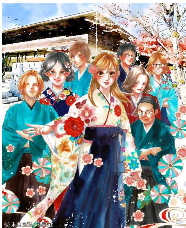
ちはやふる小倉山杯イメージ (末次由紀先生イラスト) _縦