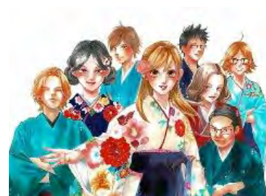
アニメ・映画化もされブレイクした「ちはやふる」