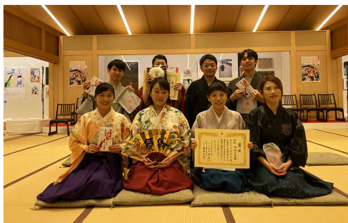
選手画像 (第一回の様子)