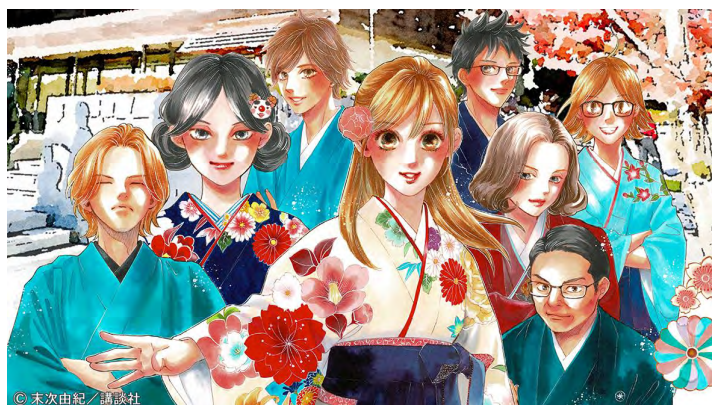
ちはやふる小倉山杯イメージ (末次由紀先生イラスト) _横