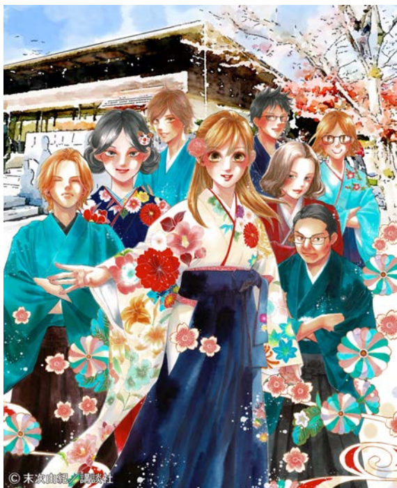
ちはやふる小倉山杯イメージ（末次由紀先生イラスト）_縦