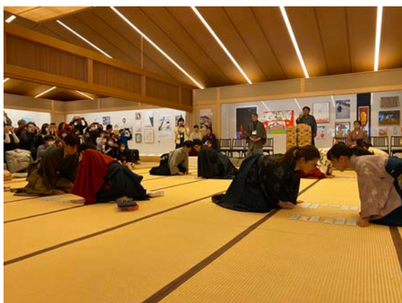
第一回 ちはやふる小倉山杯の様子_1