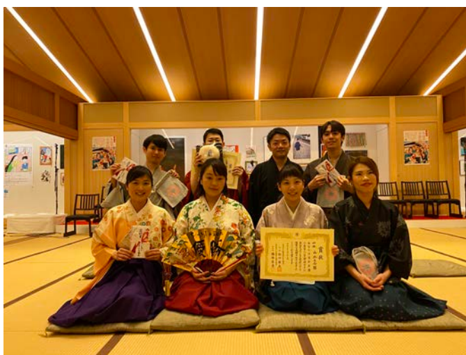
第一回 ちはやふる小倉山杯の様子_2