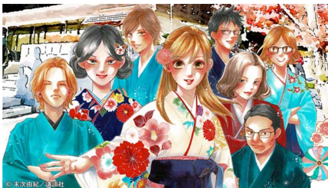
ちはやふる小倉山杯イメージ（末次由紀先生イラスト）_横