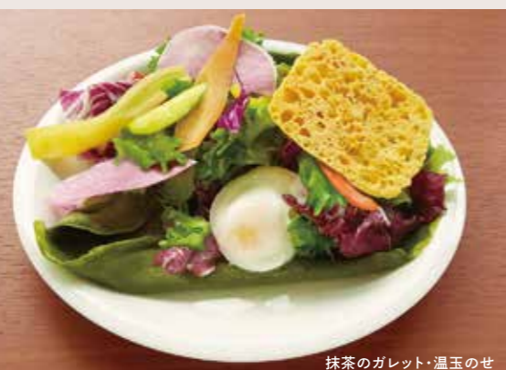
抹茶のガレット・温玉のせ