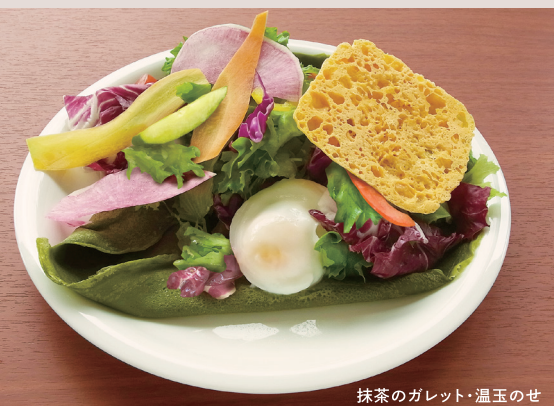
抹茶のガレット・温玉のせ