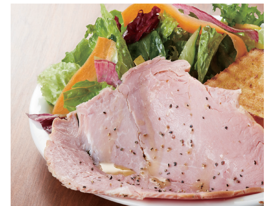
バタートーストセット ¥2,100 チーズトーストセット ¥2,200