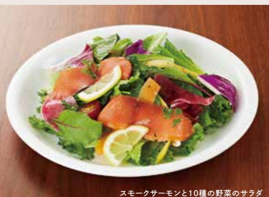
スモークサーモンと10種の野菜のサラダ