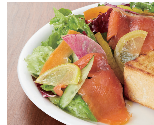
バタートーストセット ¥1,600 チーズトーストセット ¥1,700