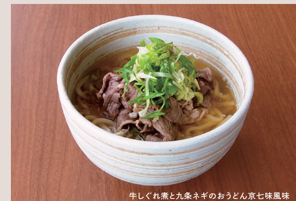
牛しぐれ煮と九条ネギのおうどん京七味風味