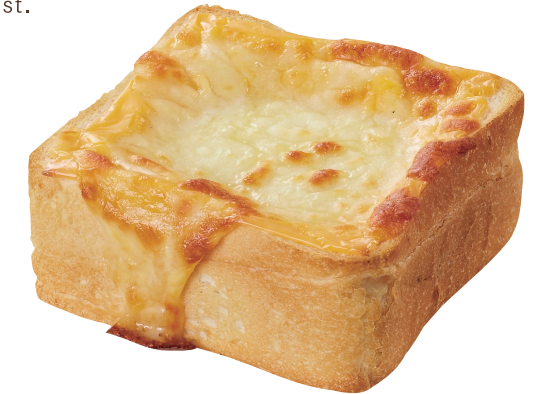
チーズトースト 単品 ¥700 CHEESE BREAD TOAST

サイドメニューをお選びください。 Please select one from the menu below.