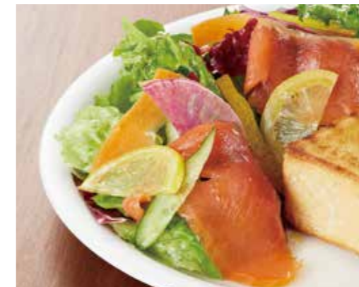
バタートーストセット ¥1,500 チーズトーストセット ¥1,600