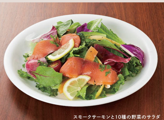
スモークサーモンと10種の野菜のサラダ