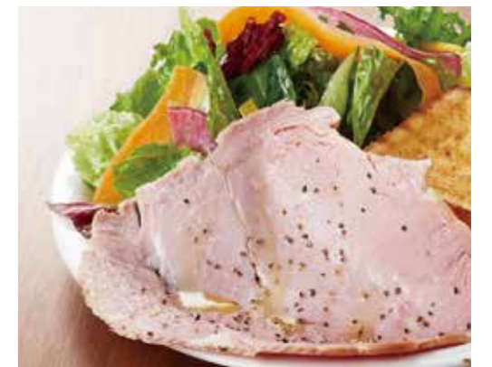
バタートーストセット ¥1,800 チーズトーストセット ¥1,900