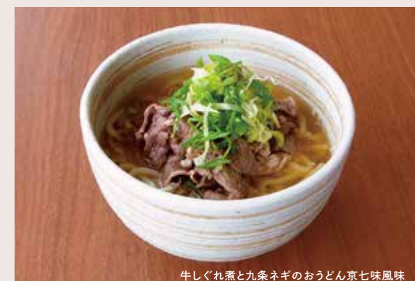
牛しぐれ煮と九条ネギのおうどん京七味風味