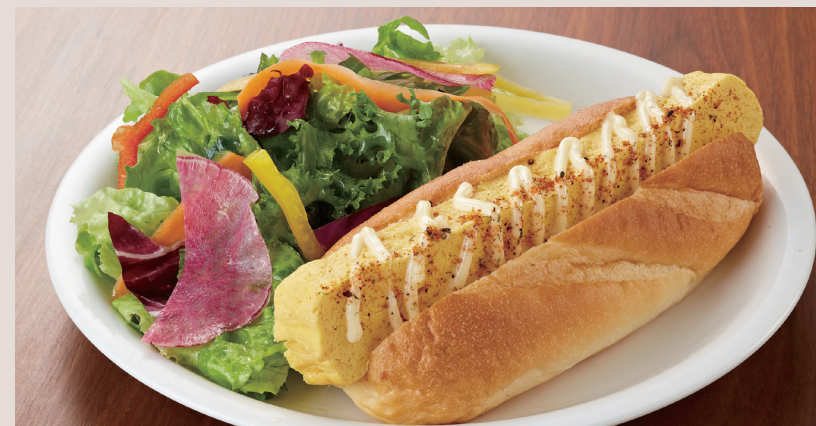
お出汁と京七味マヨの玉子焼きドッグと10種の野菜のサラダプレート SUSHI ROLL EGG SAND & FRESH SALAD ¥1,300 玉子焼きドッグ単品 ¥750

+¥450でスモークサーモンサラダにできます Add SMOKED SALMON + ¥450