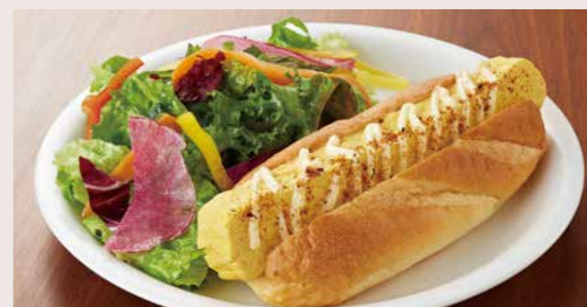
お出汁と京七味マヨの玉子焼きドッグと10種の野菜のサラダプレート SUSHI ROLL EGG SAND & FRESH SALAD ¥1,300 玉子焼きドッグ単品 ¥750

+¥350でスモークサーモンサラダにできます Add SMOKED SALMON + ¥350