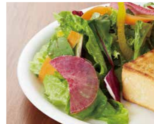
バタートーストセット ¥1,200 チーズトーストセット ¥1,300