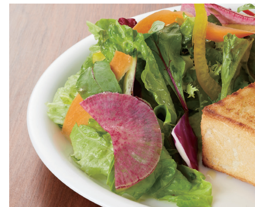
バタートーストセット ¥1,200 チーズトーストセット ¥1,300