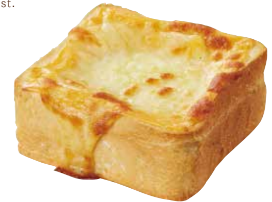
チーズトースト 単品 ¥650 CHEESE BREAD TOAST

サイドメニューをお選びください。 Please select one from the menu below.